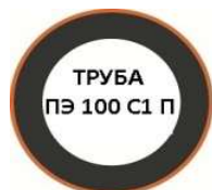
ПЭ 100 Jacket